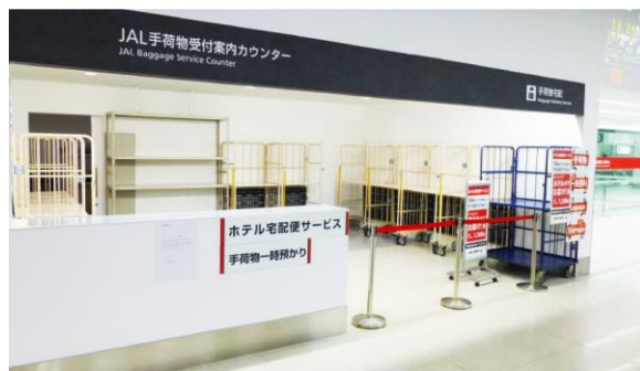
JAL 手荷物受付案内カウンター ▶