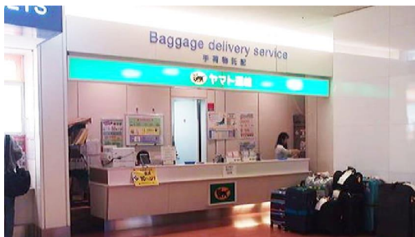
ヤマト宅急便カウンター ▶